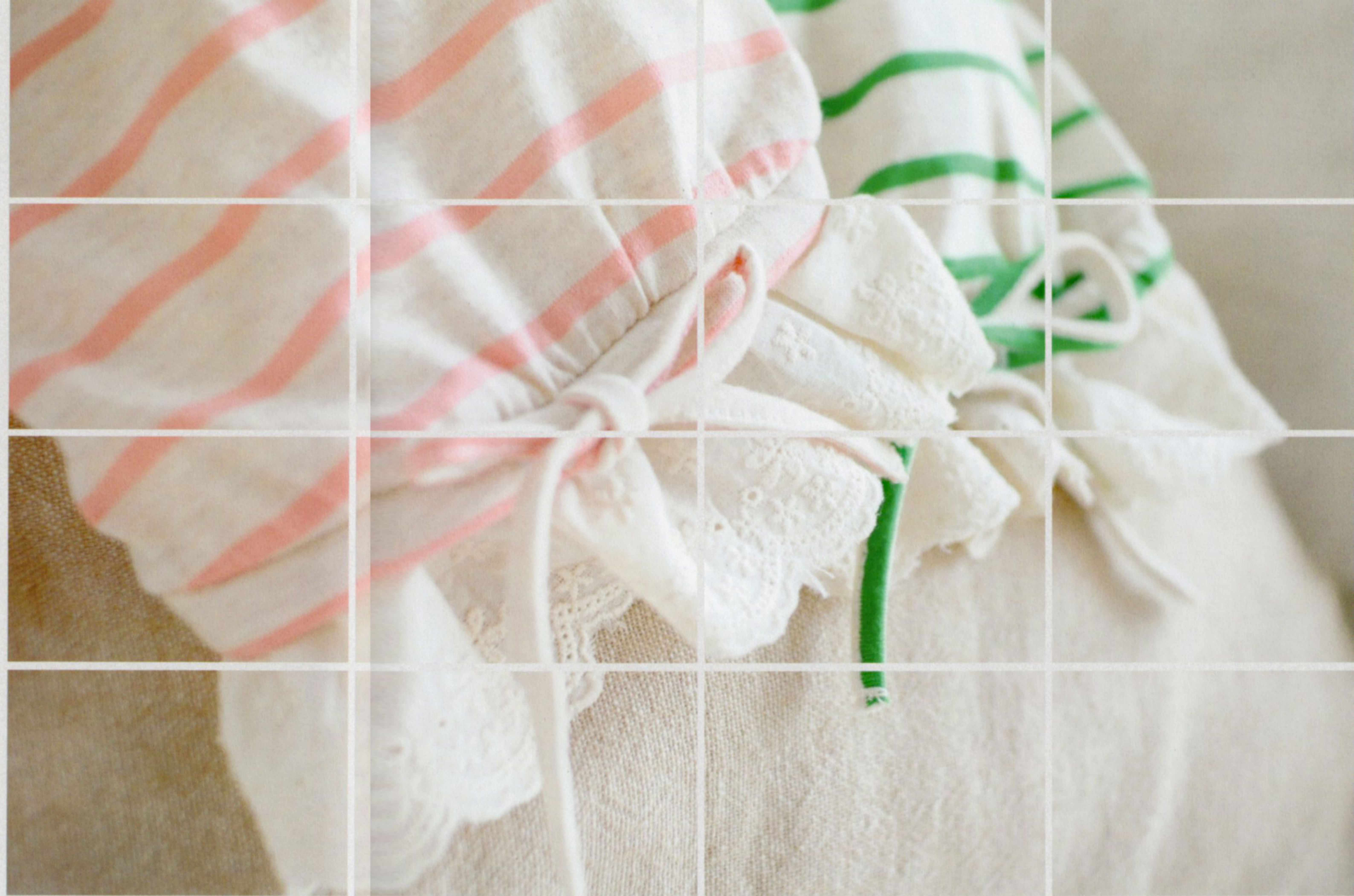
BA-013 ギャザーボーダーTOP ¥3,700 ピンクボーダー／グリーンボーダー Cotton 100%