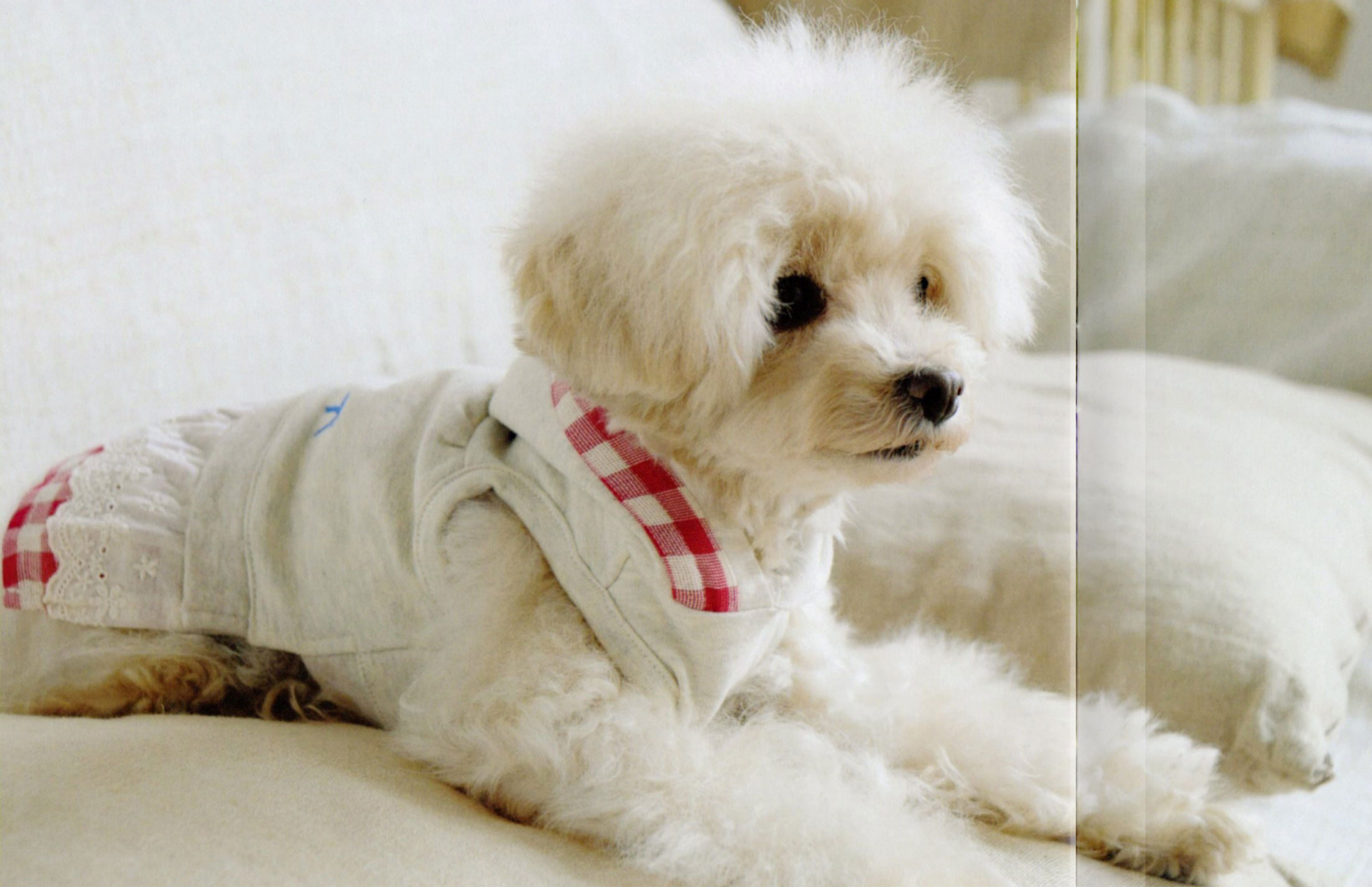
BA-016 フレンチ・レイヤーワンピース ¥4,800 レッドチェック/ブルーストライプ ボディ Cotton 98% Polyurethane 2% スカート Cotton 100%