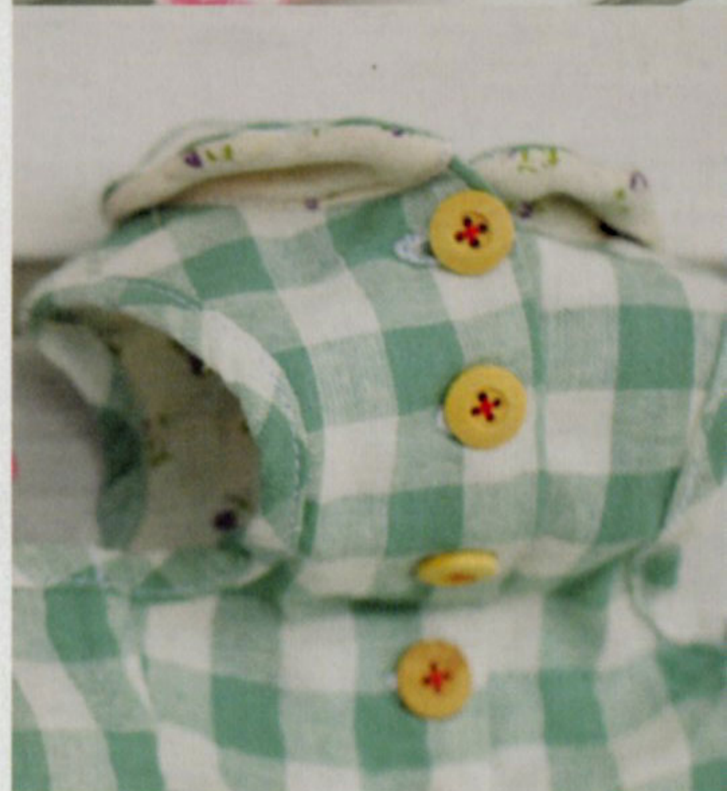
BA-014 ギンガムスカラップシャツ ¥3,800 ピンクチェック/グリーンチェック Cotton 100%