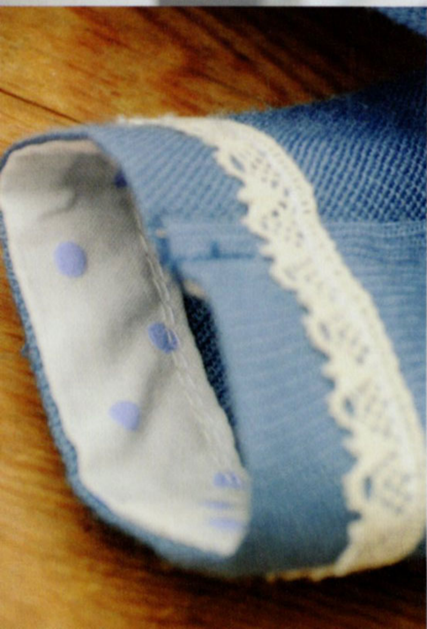
BA-015 水玉コンビネゾン ¥5,200 ピンク×ベージュ/ブルー×ブルー シャツ Cotton 100% パンツ Linen 100%