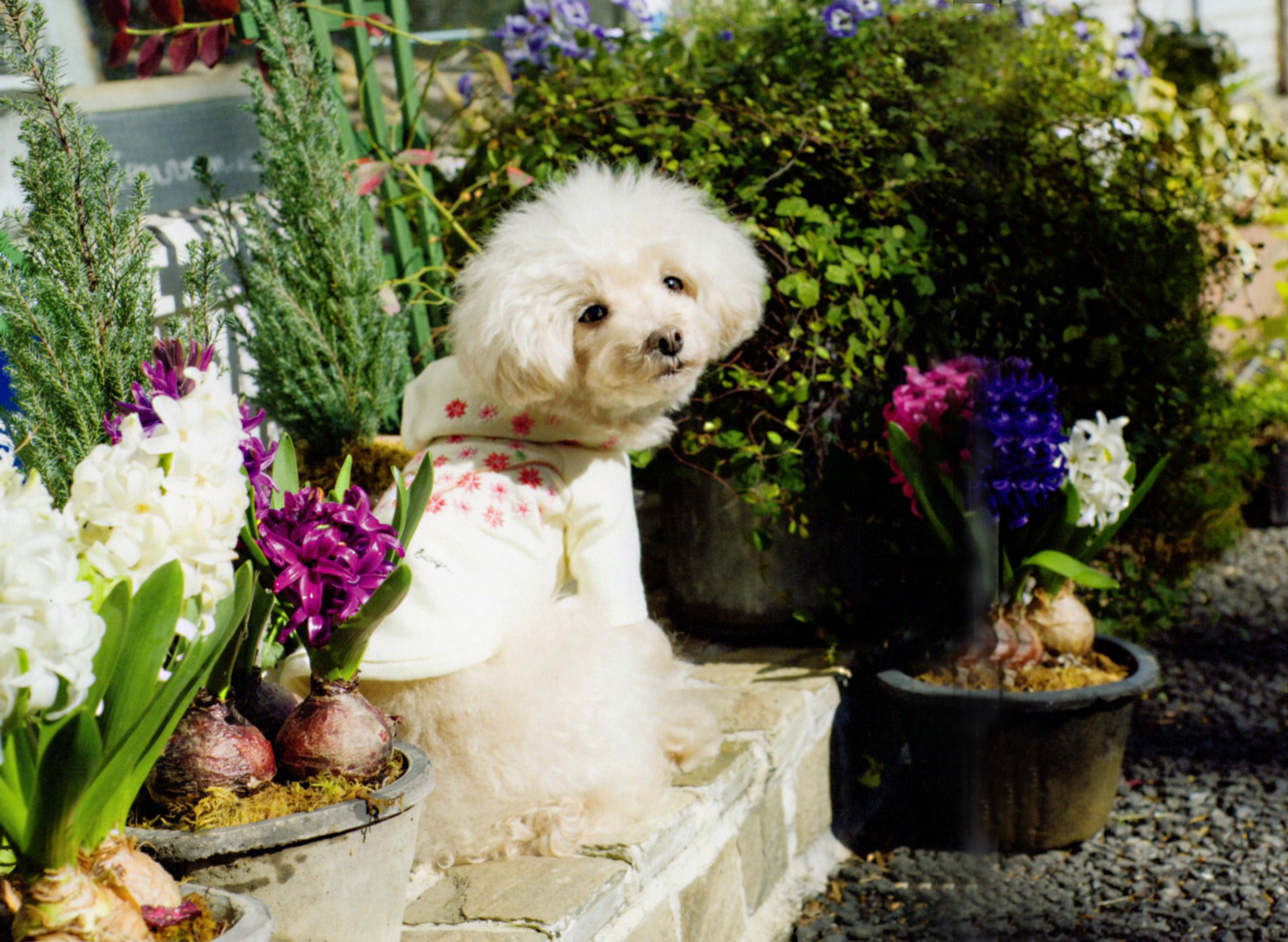
BA-011 サクラパーカ ¥4,500 アイボリー Cotton 95% Polyurethane 5%