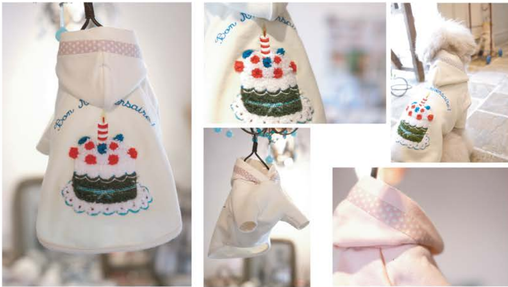
BA-001 ¥4,900 ケーキサガラ刺繍パーカ アイボリー、ピーチ