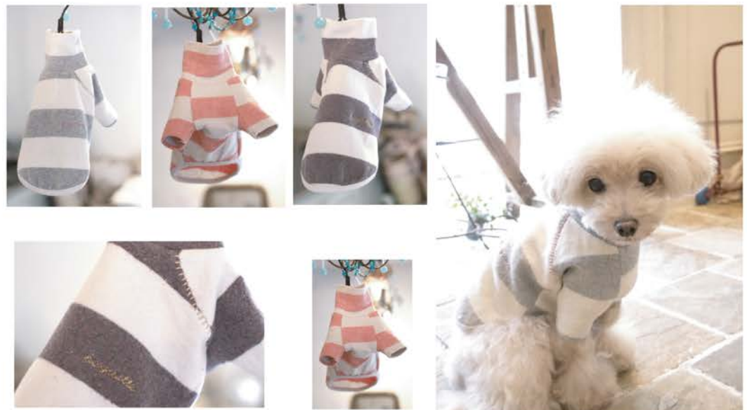
BA-002 ¥3,500 ストレッチ・太ボーダーハイネック グレー、ピンク、パープル