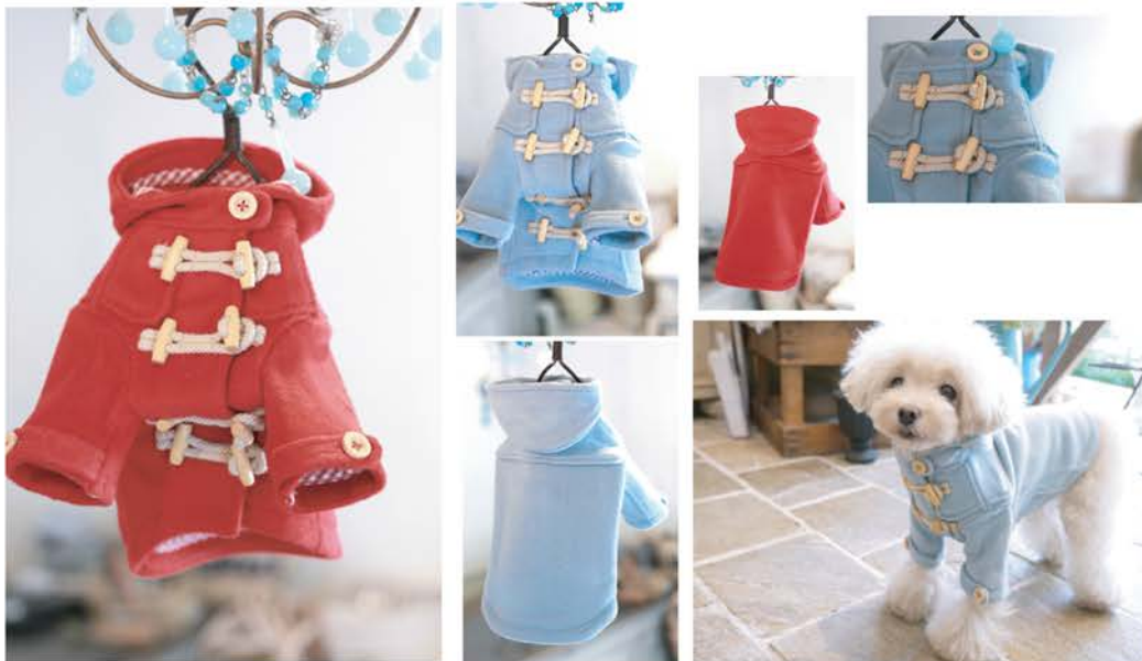
BA-008 ¥9,800 ソフト・ダッフルコート レッド、スモークブルー