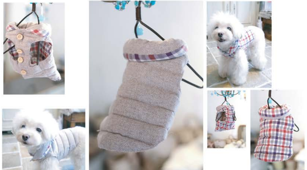
BA-009 ¥7800 ツイード・リバーシブルベスト ベージュ、パープル

※画像のチェックは、本来はパープルのツイードにつきまます。 画像のツイードはベージュのツイードです。