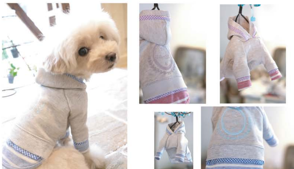
BA-003 ¥4,900 重ね着風フレンチパーカ オートミール×パープル グレー×ブルー